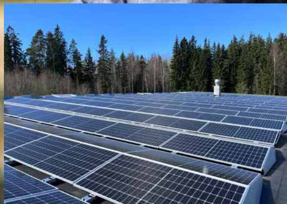
I Tierp är vi självförsörjande på el med solkraft.

Det roligaste med mitt yrke är att utveckla verksamheten – kontinuerligt förbättringsarbete är ett starkt fokus. Det gör att vi ständigt kan stärka vårt erbjudande till kund. Den kapacitet och kompetens vi byggt upp i gruppen gör att vi kan vara en produktionspartner som kan leverera högsta kvalitet och service till kundernas varierande behov.