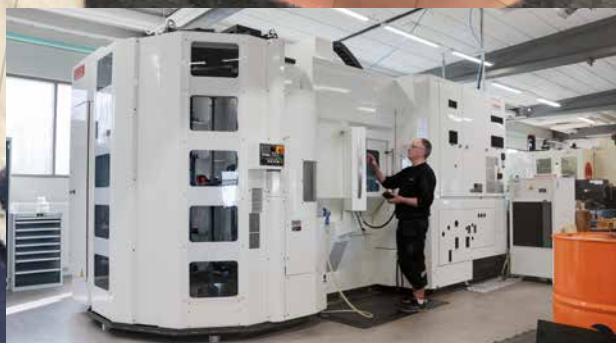
En av våra två Yasda Px30i, en 5-axlig precisionsmaskin med integrerad automation.

”Med 50 års erfarenhet av komplex bearbetning tillför vi till MF Group specialistkompetens inom skärande- och gnistbearbetning. Vi har en passion för produktionsteknik och kan lösa de klurigaste detaljerna- utmana oss gärna!”